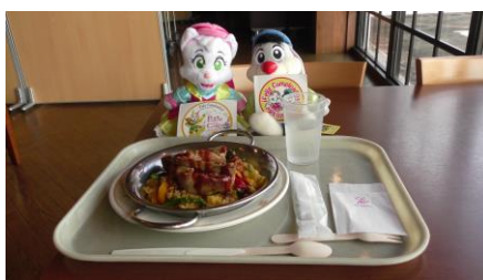
スペアリブのパエリヤ