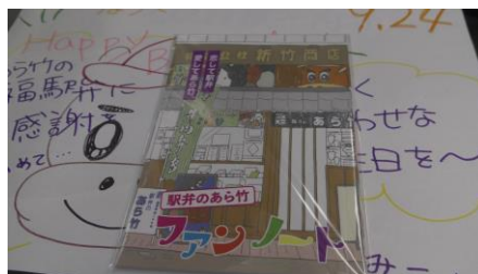
あら竹ファンノートも同時に購入