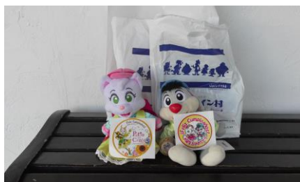
たくさんのお土産