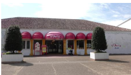
レストラン「エルパティオ」