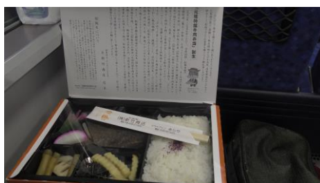
中身はこんな感じになっています