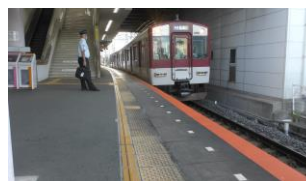
賢島行き普通電車