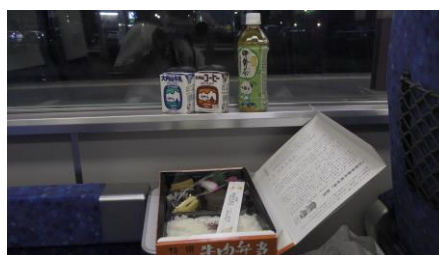
先ほど購入した飲み物と合わせて いただきます