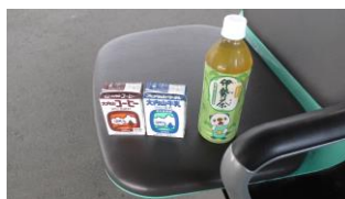
大内山牛乳・大内山コーヒー・ 伊勢茶