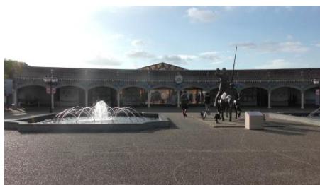
名残惜しいですが、 パルケエスパーニャを後にします