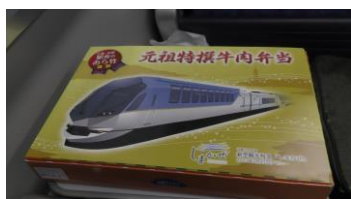
元祖特撰牛肉弁当 (今回はしまかぜの掛け紙を 選びました)