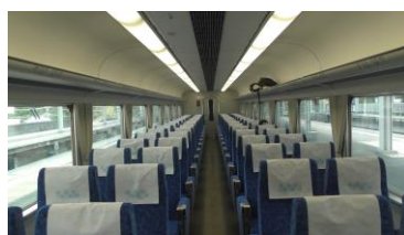
サニーカーの車内 (青色のモケットの車両でした) (他の編成はエンジのモケット)