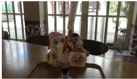
とても高いチュロスが トッピングされています