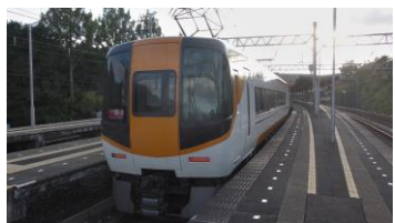
前に ACE2 両と Ace2 両を 繋いでいます