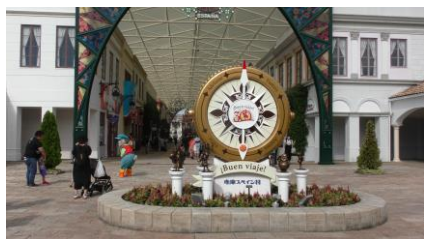
エスパーニャ通りのモニュメントも 30 周年仕様になっています